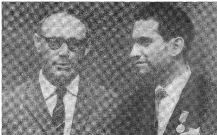
Москва, 1960. Перед матчем на первенство мира с М. Талем

Но все это были, конечно, сказки да присказки. В чем же состояла реальная основа его шахматной силы?